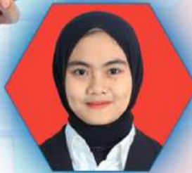
Nurfahira, S.Ak Selai Moodku Pepaya

Selain itu Kuliah tamu dari tokoh-tokoh industri terkemuka memberi kami wawasan berharga tentang tren dan tantangan terbaru dalam dunia bisnis. Setelah lulus, Nobel telah membekali saya dengan fondasi yang kuat, baik dalam hal pengetahuan maupun keterampilan praktis yang diperlukan dalam dunia bisnis