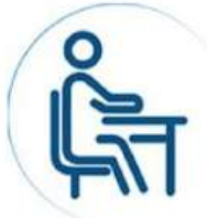
RUANG KULIAH NYAMAN