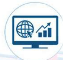
GERAI INVESTASI BEI